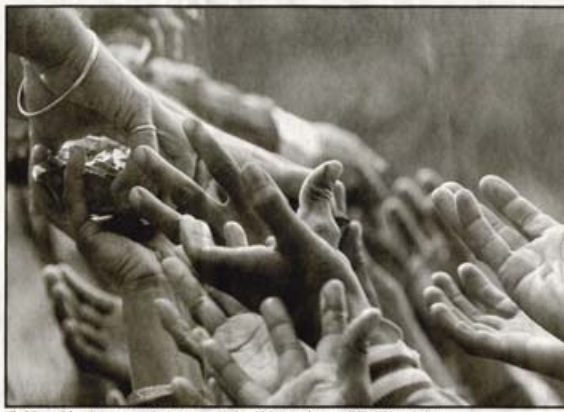
„Die können nicht mit eurem kompletigen europäischen Meinungs kommen.“ Ein Bild aus Indien.

Lokalausgaben im indischen Werk von Samsung in Noida nahe Delhi. Seit acht Jahren lässt die südkoreanische Elektronikfirma in Indien produzieren, vor allem Farbfernseher, Waschmaschinen, Mikrowellenöfen und Mobiltelefone. Hier arbeiten 1300 Menschen, davon 800 Arbeiter, etwas mehr als die Hälfte davon Männer.