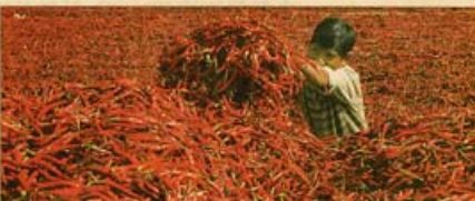
„Zerfärbenes, was wir an ihnen verdient haben.“ Ist das Motto der Corporate Social Responsibility in Betriebskloppeln – ein „Jahres“ ist die Veröffentlichung mehrerer Berichte.