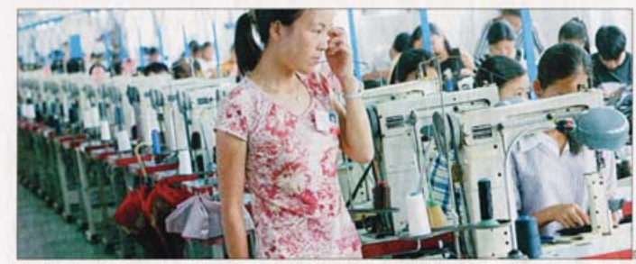
Arbeitsplätze in einer Schuhfabrik in der chinesischen Stadt Wenzhou, wo pro Jahr über eine Milliarde Paare produziert werden.