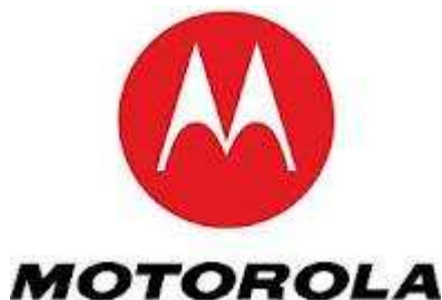
Motorola Mobility: Firmensitz in USA, Illinois