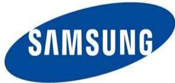
Samsung: Firmensitz in Südkorea, Seoul

Die Handyfirmen sind für die Entwicklung und die Produktion der Handys verantwortlich. Mehrmals im Jahr bringen Sie neue, innovative Modelle auf den Markt. Wer mit den neuesten Trends nicht mithalten kann, fällt im Markt zurück. Die Entwicklung neuer Handys wird von den Handyfirmen selber vorangetrieben, die Produktion wurde in Billiglohnländer ausgelagert.