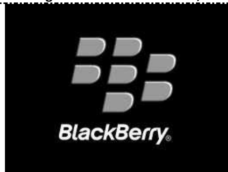
Blackberry: Produkt der Firma RIM (Research in Motion), Firmensitz in Kanada, Waterloo