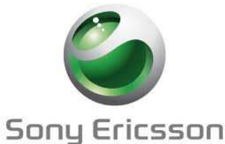
Sony Ericsson: Tochterunternehmen von Sony, Firmensitz in UK, London