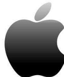
Apple: Firmensitz in USA, Kalifornien