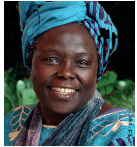
Mutter der Bäume: Wangari Maathai

Die Ausstellung wird am 14. Mai bei der Jubiläumsfeier des Botanischen Gartens Linz beim „Festtag für Alle“ eröffnet. Von 11 bis 18 Uhr gibt es buntes Bühnenprogramm, Musik- und Showeinlagen, Standmarkt und Kinderangebote. Außerdem finden zwei Führungen durch die Ausstellung statt. Bis 1. November kann die Ausstellung im Freiland des botanischen Gartens besucht werden. Für Schulklassen und Interessierte werden auch Führungen angeboten.