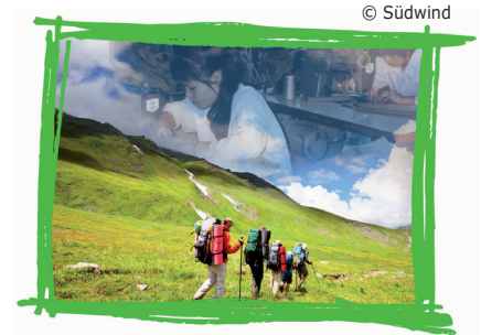
Zielgruppe: Sekundarstufe II

Mit der gleichnamigen Ausstellung (siehe Seite 2) können die neu vermittelten Kenntnisse vertieft werden.