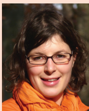
Neu im Südwind OÖ Team

Weitere Informationen: Südwind OÖ, 0732/79 56 64 ooe@suedwind.at www.suedwind-agentur.at/ooe