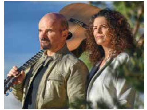
Der Sonntag steht mit Kinderbetreuung und Kasperltheater ganz im Zeichen der Familie. Höhepunkt wird der Auftritt der Außerferner Band „Bluatschink“ um 15.00 Uhr sein.

16.00 Workshop Naturkosmetik Intensivkurs Anmeldung: elisabeth.nagy@suedwind.at