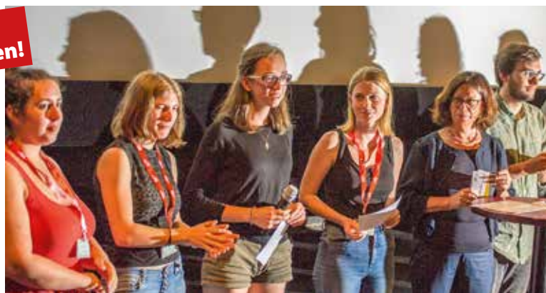
2018 vergab die IFFI-Jugendjury den Südwind-Filmpreis an „Wallay“ und seinen Regisseur Berni Goldblat

Südwind ist auch heuer wieder Teil des Internationalen Filmfestivals Innsbruck (IFFI) und vergibt zum elften Mal den Südwind-Filmpreis im Wert von € 1.000 an eine/n FilmemacherIn aus dem globalen Süden. Das Preisgeld wird durch Ihre Spende an den Verein Südwind Tirol ermöglicht. Über die Vergabe des Preises entscheidet die IFFI-Jugendjury, zu der