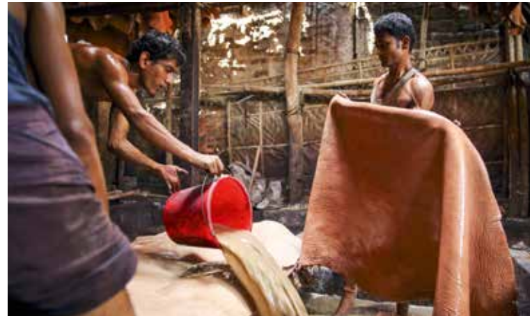
Gerberei in Bangladesch: Die ArbeiterInnen sind gesundheitsgefährdenden und krebserregenden Chemikalien oft direkt ausgesetzt.