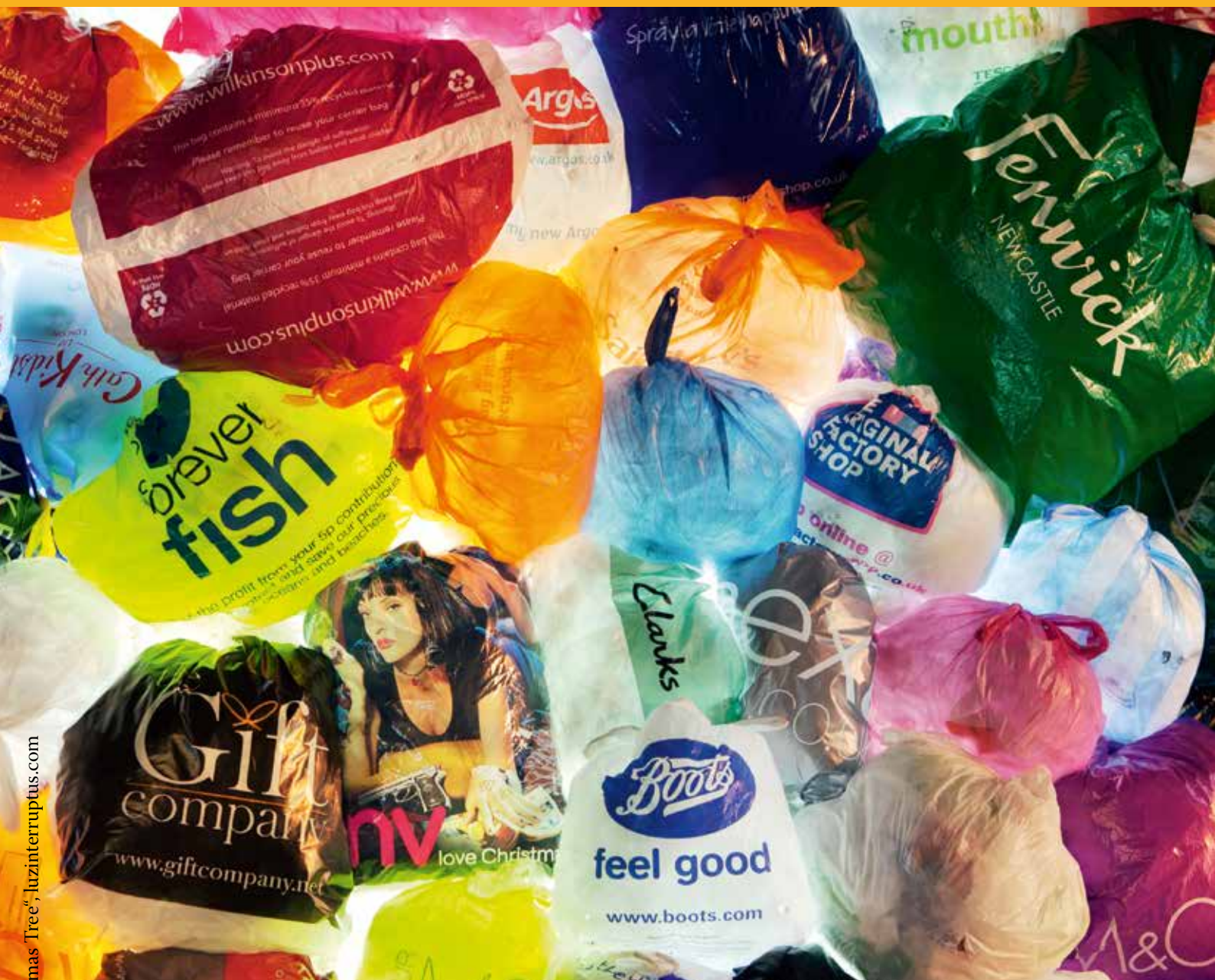
Foto: Gustavo Sanabria, „Consumerist Christmas Tree“, luzinterruptus.com

ENTWICKLUNGSPOLITISCHE INFORMATIONEN VON SÜDWIND TIROL