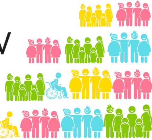
Kinder, Jugendliche und Jugendorganisationen