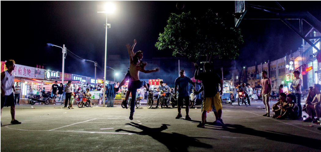
Täglich treffen sich ab 8 Uhr abends junge Männer für ein Basketball-Match außerhalb des Wistron-Geländes.

rechte im gesamten Beschaffungsprozess berücksichtigen müssen, angefangen von der Festlegung gesetzlicher Regeln und Grundsätze für die Beschaffung über Planung, Risikobewertung und Ausschreibung bis hin zu Monitoring und Überprüfung“.