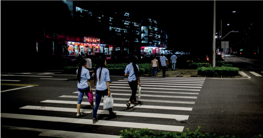
Nach 12 Stunden Schichtarbeit gehen Studierende zurück in ihr Wohnheim.