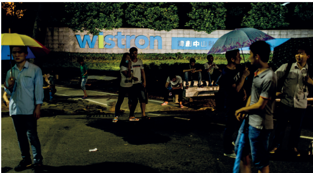
ArbeiterInnen verlassen um 8 Uhr abends die Wistron-Fabrik

DanWatch hat die Lieferkette von Servern, die an europäischen Universitäten eingesetzt werden, bis zu den Fertigungslinien der Wistron Corporation in Zhongshan verfolgt. Dort werden Server für HP, Dell und Lenovo hergestellt. DanWatch interviewte 25 PraktikantInnen. Neun von ihnen gaben gegenüber DanWatch an, von ihren Schulen zu diesen Praktika gezwungen worden zu sein: Man drohte ihnen, sie durchfallen zu lassen, wenn sie die Arbeit bei Wistron verweigerten.