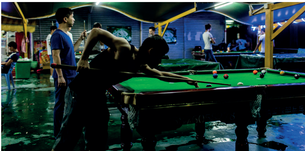
Pool-Tische im Erholungsbereich außerhalb der Wistron-Fabrik

„Wir arbeiten am Wochenende, weil die Stammebelegschaft auf Urlaub ist und wir sie ersetzen müssen“, erklärte sie.