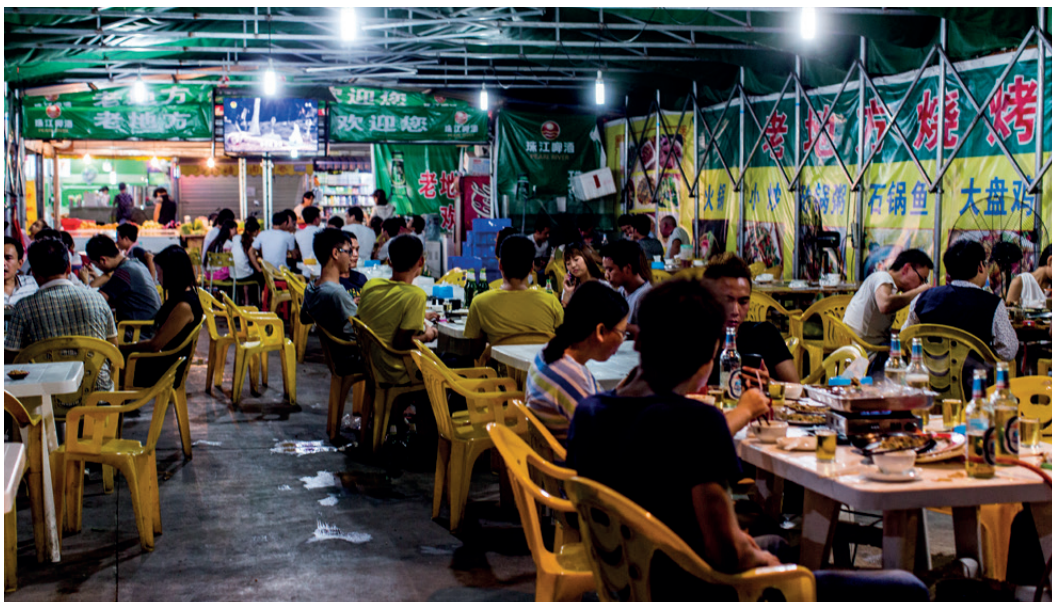
PraktikantInnen und ArbeiterInnen genießen ihre spärliche Freizeit.

„Dem Text nach sorgt das Gesetz für einen guten Schutz, aber die Umsetzung der Vorschriften durch die lokalen Behörden ist sehr schlecht.“