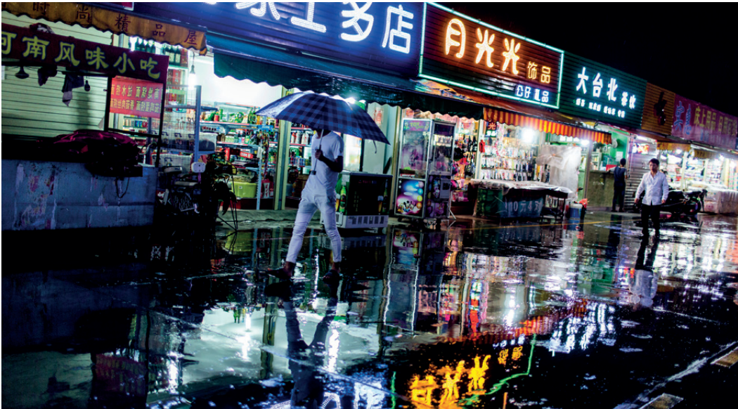
Die Geschäfte und Restaurants außerhalb des Wistron-Geländes decken die Grundbedürfnisse der Beschäftigten ab.

Elaine Sioleng Hui glaubt, dass öffentliche Beschaffungsstellen in Europa einen positiven Beitrag zum besseren Schutz der ArbeiterInnenrechte in China leisten können. Sie hält es aber für sehr wichtig, dass sich öffentliche Institutionen der Schwächen von CSR bewusst sind, insbesondere im Hinblick auf durchsetzbare Regeln und Verantwortlichkeiten. „Verhaltenskodexe, UNGP und CSR-Programme sind ‚Soft Law‘. Wenn man sie nur mangelhaft befolgt oder sich gar nicht daran hält, wird niemand bestraft, weder die Unternehmen noch die öffentlichen Auftraggeber“, erläutert Hui. Hui und K.C. Chan kommen in ihrer Analyse zum Schluss, dass „Soft Law“ ein effektives Mittel geworden ist, um gesetzliche Verpflichtungen zu vermeiden und/oder zu verringern.