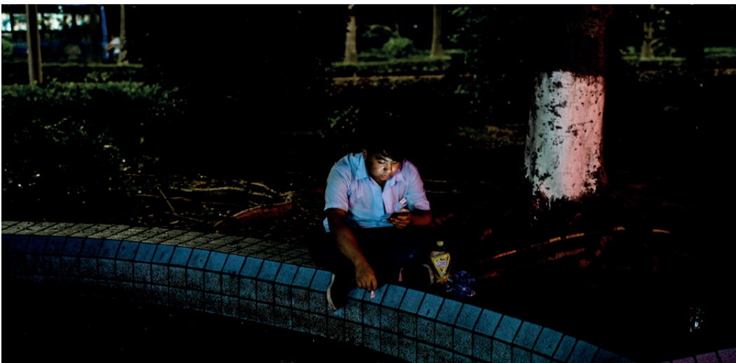
Junge Studierende sind unersetzbar billige Arbeitskräfte für Chinas Elektronikindustrie.

Das Problem mit dem Missbrauch der Praktika ist komplex und strukturell bedingt, wie Liang zugibt, und viele Akteure sind beteiligt. Doch wäre die „Komplexität“ mittlerweile eine billige Ausrede, die zu oft von Markenherstellern benutzt worden sei, um den Status quo aufrechtzuerhalten. „Die lokalen Behörden sind auf Investitionen angewiesen. Lieferanten und Markenhersteller könnten durchaus Druck auf die lokalen Behörden und Schulen ausüben, damit die Gesetze genau eingehalten werden, falls sie das wirklich wollten: die Macht dazu hätten sie. Geld regiert die Welt, und die Regierung mag vielleicht darüber hinwegsehen, dass die Rechte von Praktikanten verletzt werden, aber sie würde zweifellos nichts dagegen haben, wenn die Unternehmen ihre Beschäftigten endlich korrekt behandeln würden“, ist sich Pui Kwan Liang sicher.